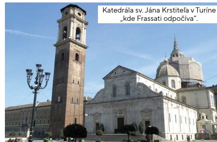
Katedrála sv. Jána Krstiteľa v Turíne „kde Frassati odpočíva“.