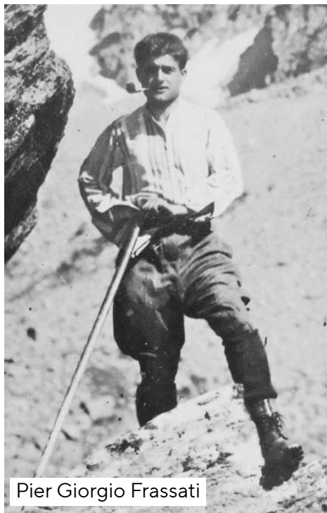
Pier Giorgio Frassati

Ešte keď bol mladý chlapec, jedného rána zaklopala na dvere ich domu krehká žena s bosým dieťaťom v náručí. Pier Giorgio rýchlo