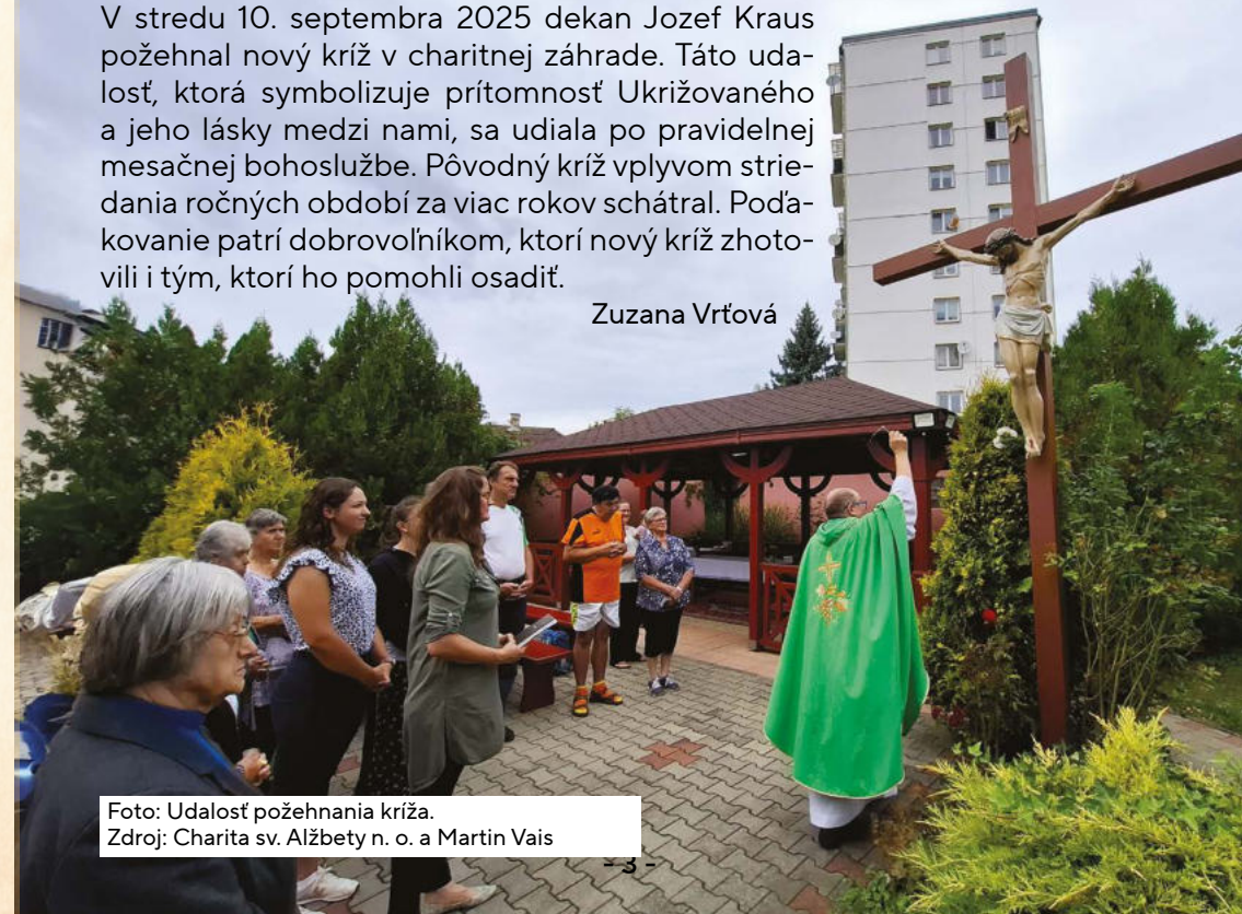
Foto: Udalosť požehnanie križa.